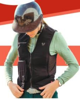
1 participation par foyer modalités au verso →